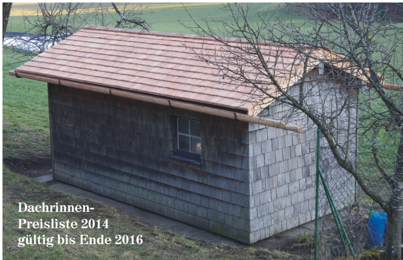
Dachrinnen- Preisliste 2014 gültig bis Ende 2016

Bei Bedarf bitte unseren Holzdachrinnen-Prospekt mit Preisliste anfordern, oder auf unserer Webseite downloaden.